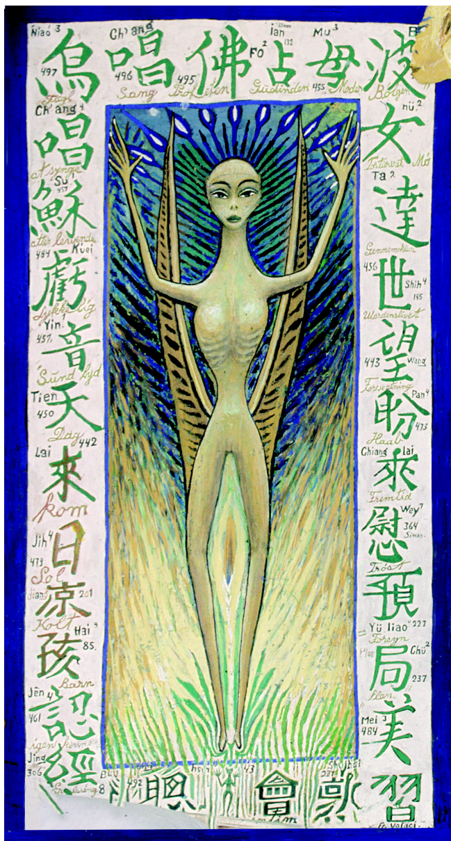
Ovartaci: Gudinden i Universet

En dag sagde han til Ovartaci: Hvis du vil tage med mig til Paris, kan jeg gøre dig til millionær på én dag. Til det svarede Ovartaci, at han var hverken interesseret i at blive berømt eller millionær.