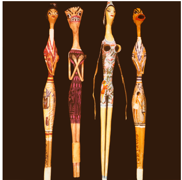
Ovartaci: Fire rygefantomer

Beskriv rygefantomerne: Deres udseende, ansigt og krop.