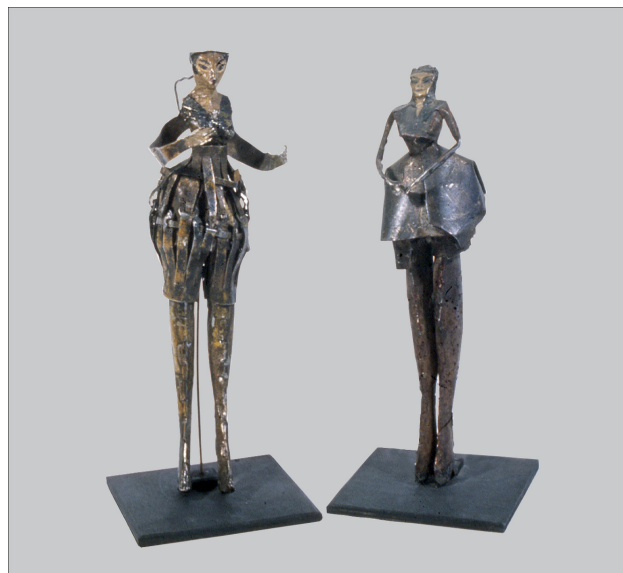
Ovartaci: To skulpturer

Han brugte endda også sardindåser. En overgang måtte man som patient ikke få metal at arbejde med. Det problem løste Ovartaci ved at bede om at få sardiner at spise. Han tog sardindåserne og forvandlede dem til sjove skulpturer. I kan se nogle her.